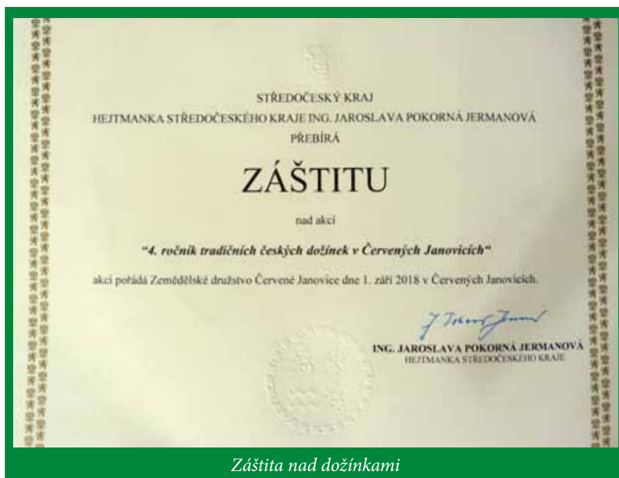
Záštit nad dožínkami

V tomto roce provádíme odbahnění rybníka Vilémovice z vlastních zdrojů a vlastní mechanizací. Odbahnění je prováděno odborně a ve vysoké kvalitě.